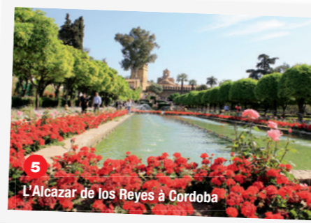
5 L'Alcazar de los Reyes à Cordoba