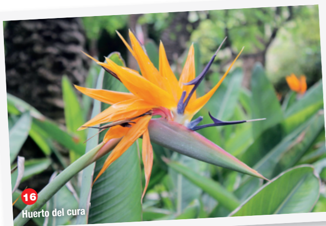
16 Huerto del cura

places, un sol bien stabilisé, un bloc sanitaire avec WC et douches (payantes pour 1 €). L'ensemble pour 12 € avec l'électricité.