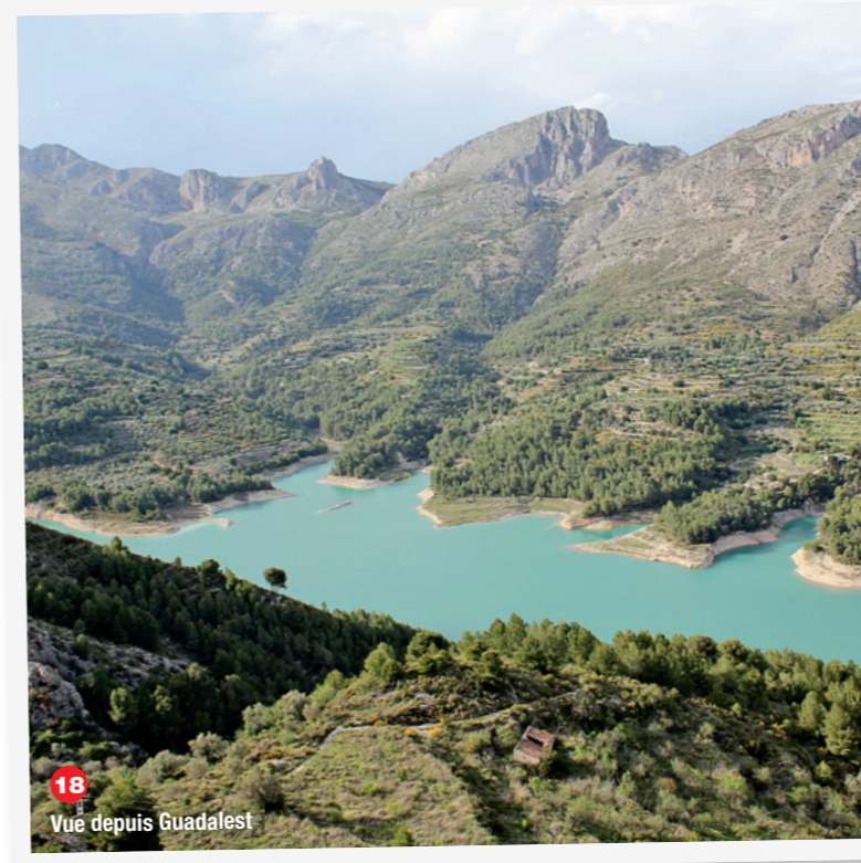
18 Vue depuis Guadalest