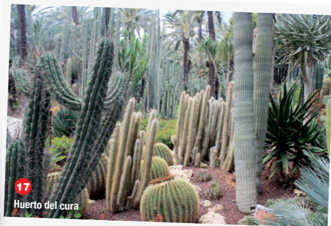
17 Huerto del cura