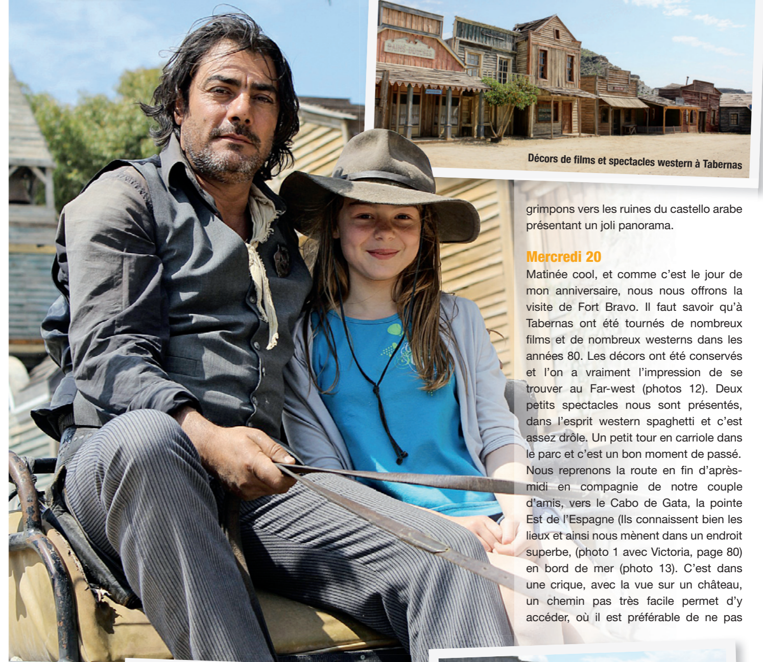
12 Far West à Tabernas