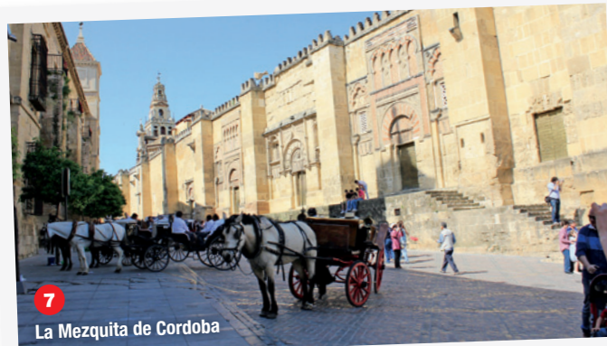
7 La Mezquita de Cordoba