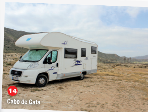
14 Cabo de Gata