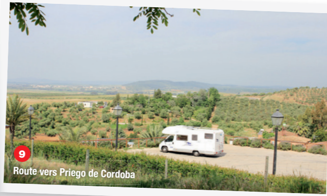
9 Route vers Priego de Cordoba