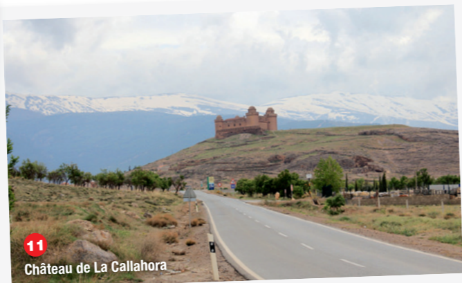
11 Château de La Callahora