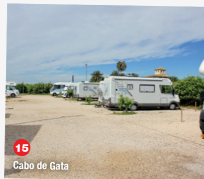
15 Cabo de Gata

la nuit à une quinzaine de kms, sur une aire privée nouvellement créée (GPS : N38°00.441 W1°02.629). Cette aire est très bien conçue, avec une trentaine de