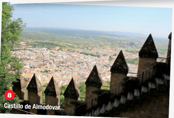
8 Castillo de Almodovar