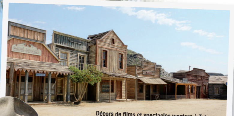
Décors de films et spectacles western à Tabernas

grimpons vers les ruines du castello arabe présentant un joli panorama.