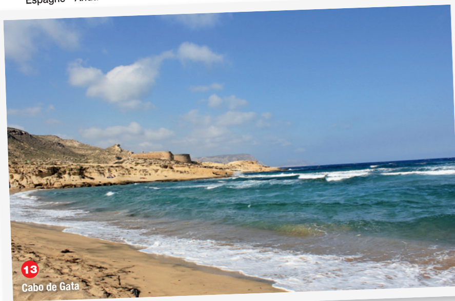
13 Cabo de Gata

croiser un autre véhicule. Les C.C. de plus de 7 mètres sont conseillés de ne pas s'y aventurer. J'ai frotté un peu les buissons... (GPS N36°51.472 W2°00.265). Champagne pour le grand événement du jour... et repas à l'intérieur du C.C. car le vent vient de se lever et souffle de plus en plus fort !